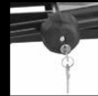
POMELLO ANTIFURTO (DI SERIE) SECURITY KNOB (AVAILABLE)