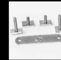
ART. 364 KIT PER BARRA A "T" KIT FOR "T" BAR