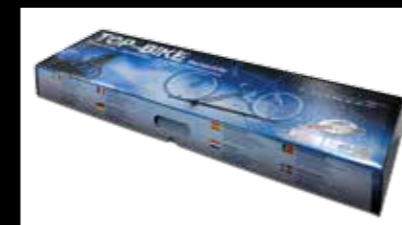
ART. 314 SCATOLA FULL COLOR BOX