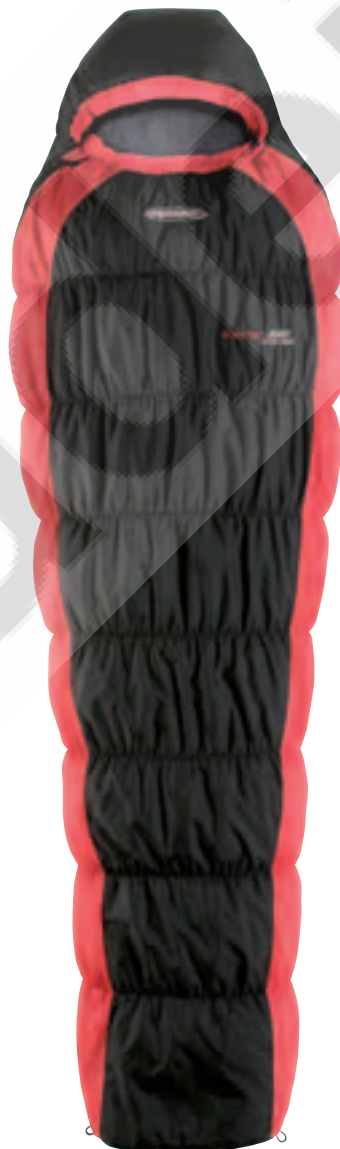
NIGHTEC 600 LITE PRO