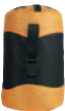
Sacca compressione Compression stuff sack